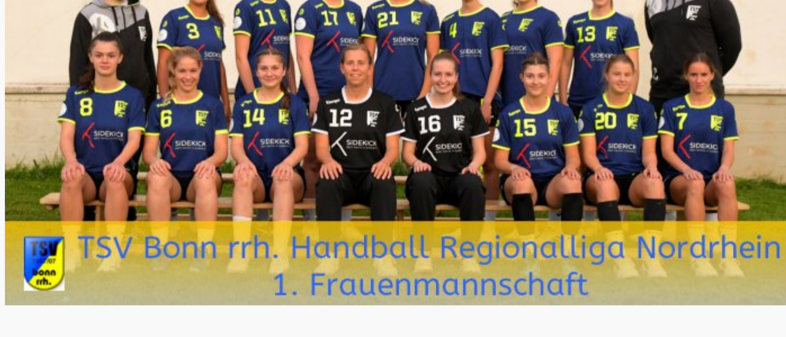
Fast ein verdammtes Handballjahr lang war Funkstille. Nix, kein einziger geworfener Ball. Furchtbar!