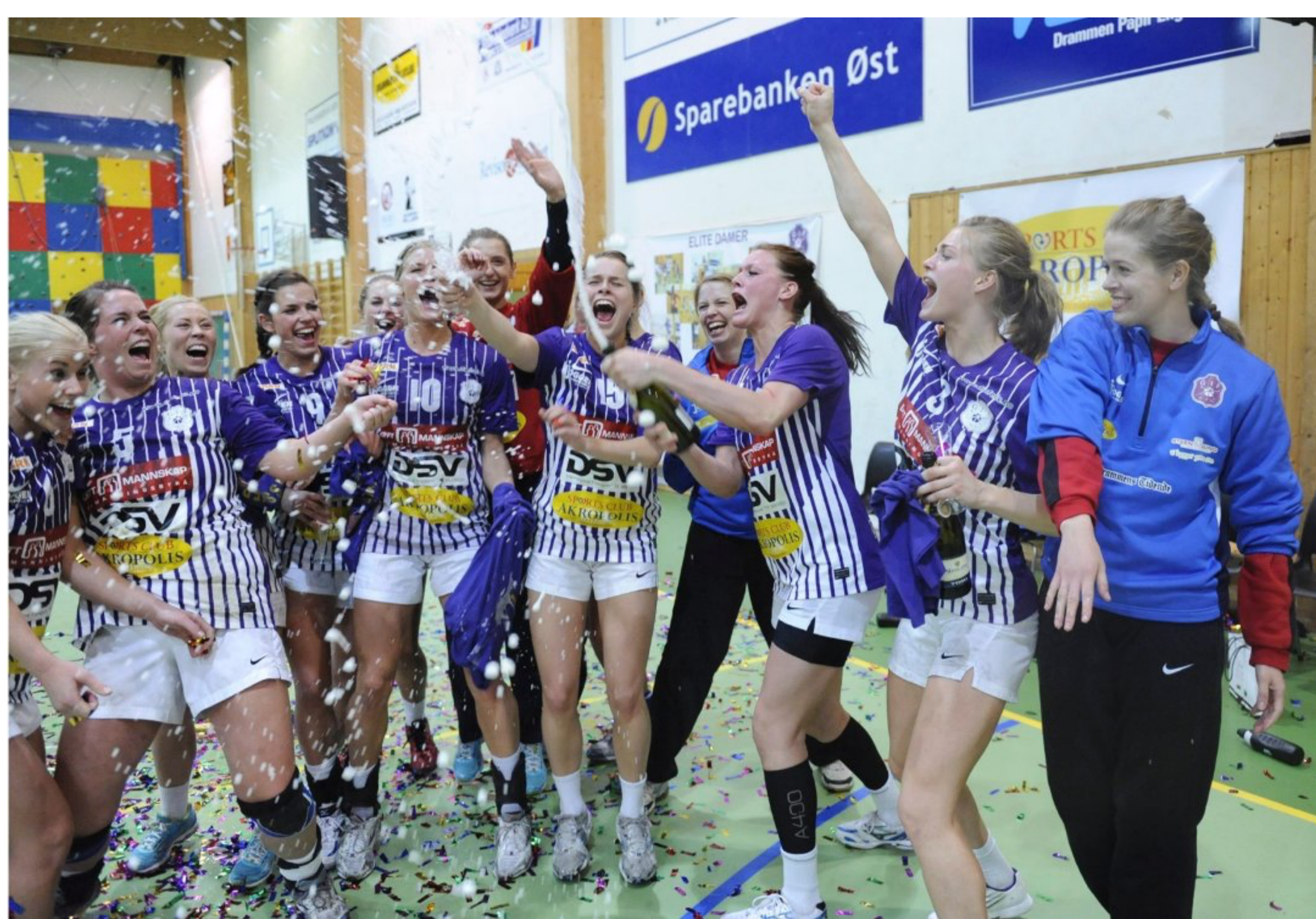
Champagnekorken spratt og boblene sto i været da det ble klart at Glassverket rykker opp.