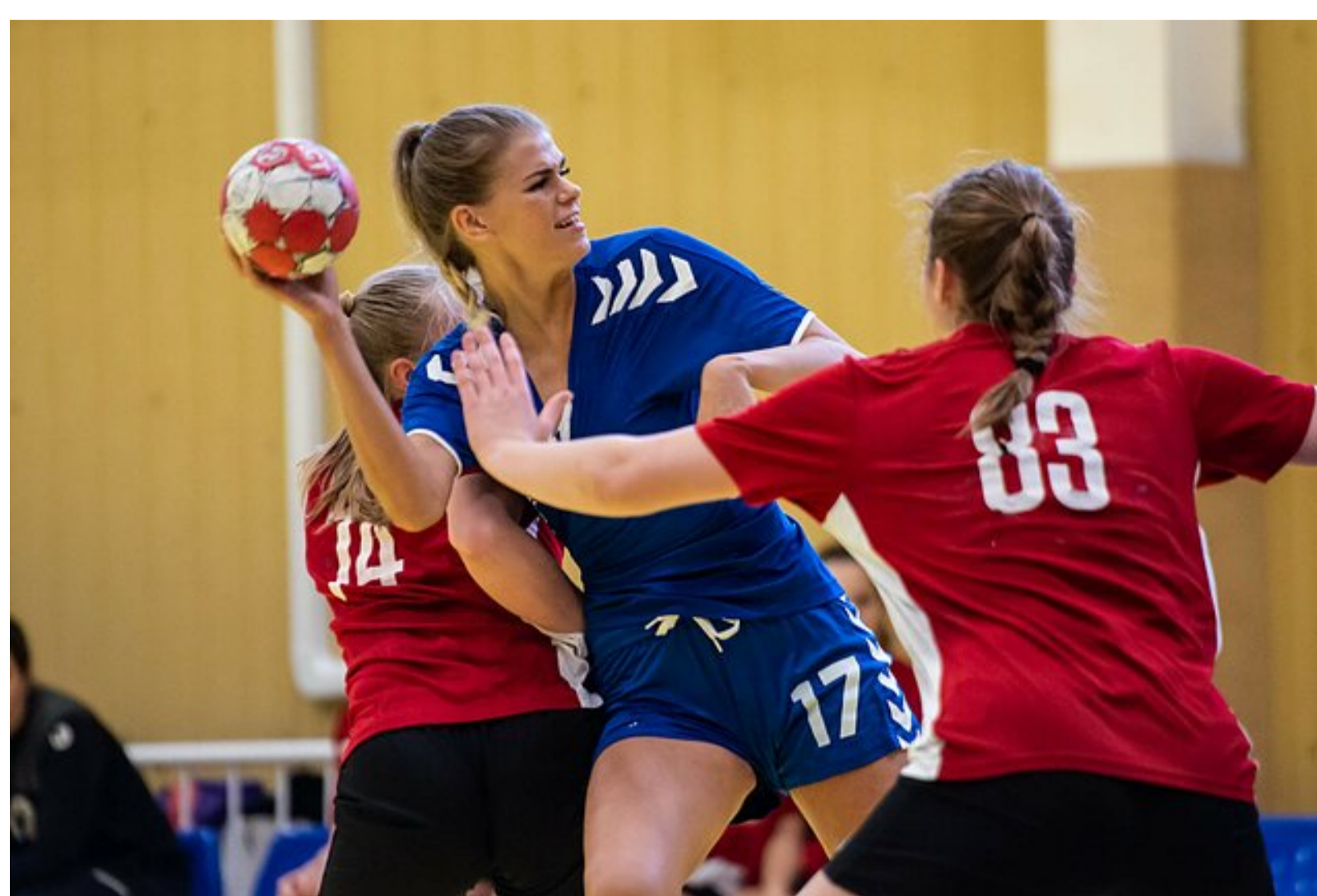
Lietuvos moterų rankinio lyga / Dominyko Repečkos nuotr.

Savaitgalį Lietuvos moterų rankinio lygoje (LMRL) vyko keturios intriguojančios kovos, po kurių lygoje nebeliko komandų, kurios nebūtų barsčiusios taškų, rašo handball.lt.