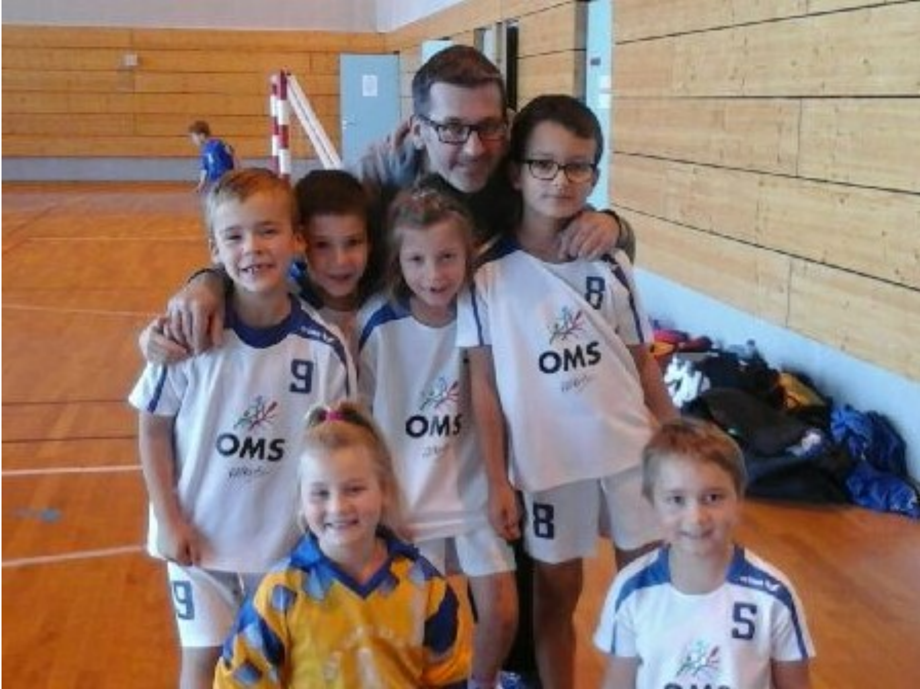
Equipes des moins de 9 Mixte