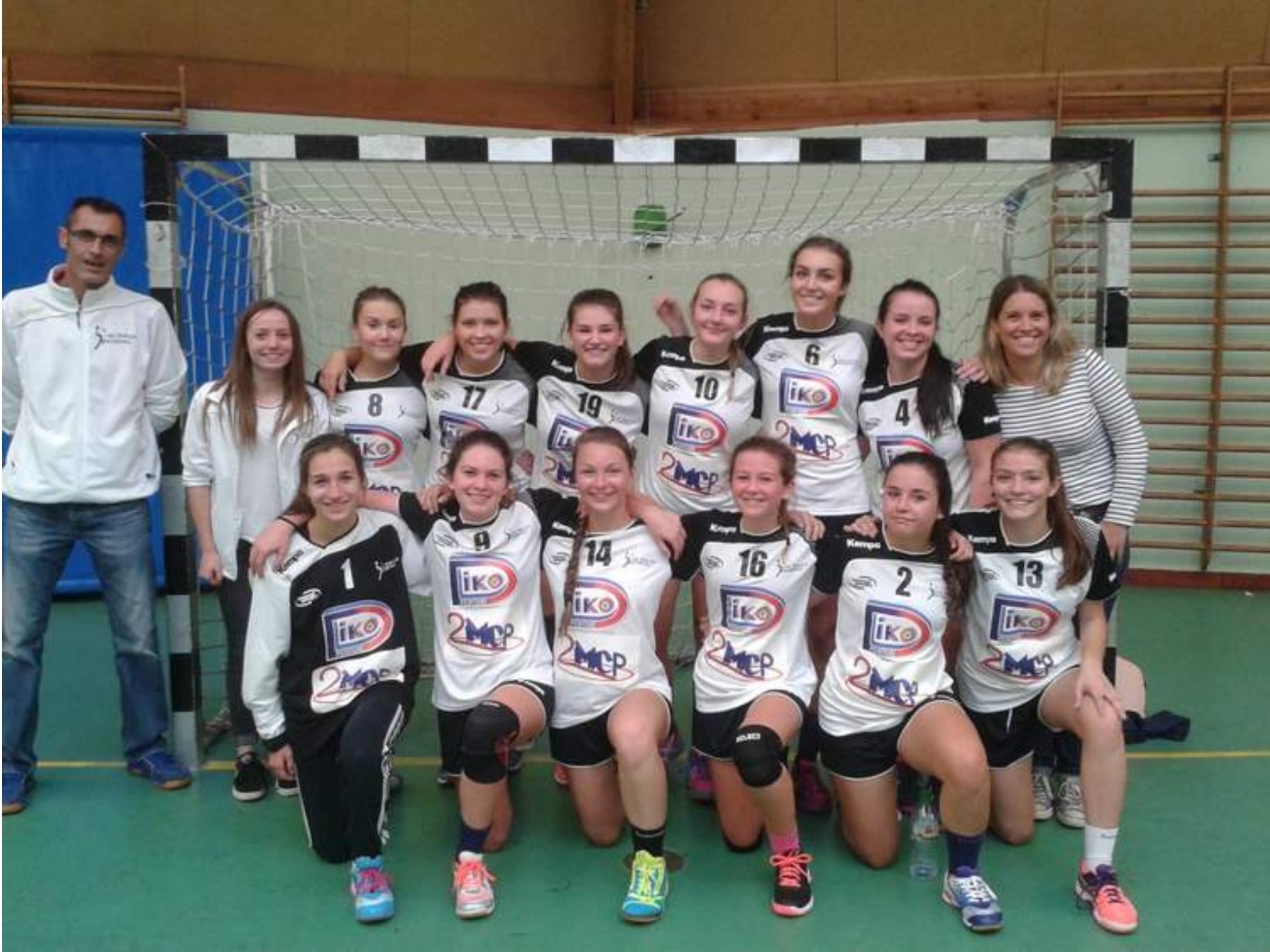
Classement des moins de 18 ans Féminines