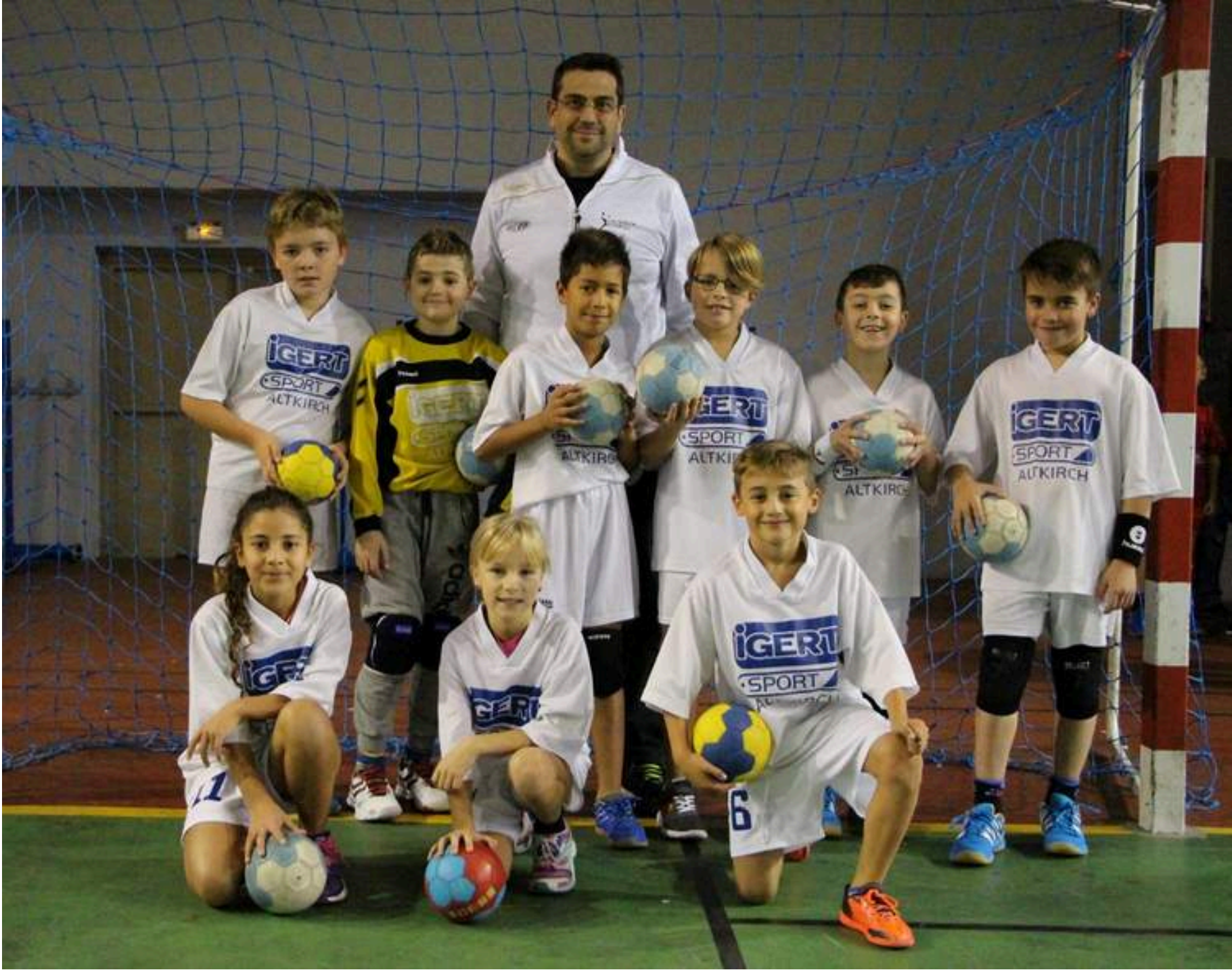
Équipes des moins de 11 Mixte