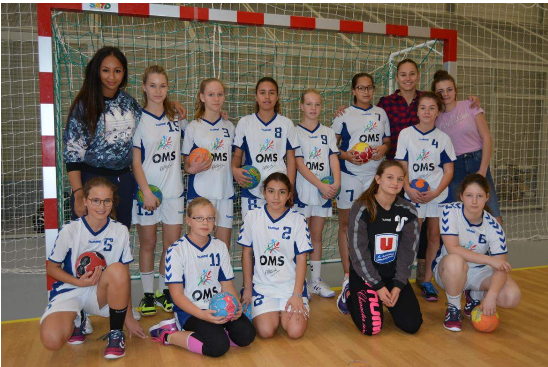
Classement des moins de 15 Féminines