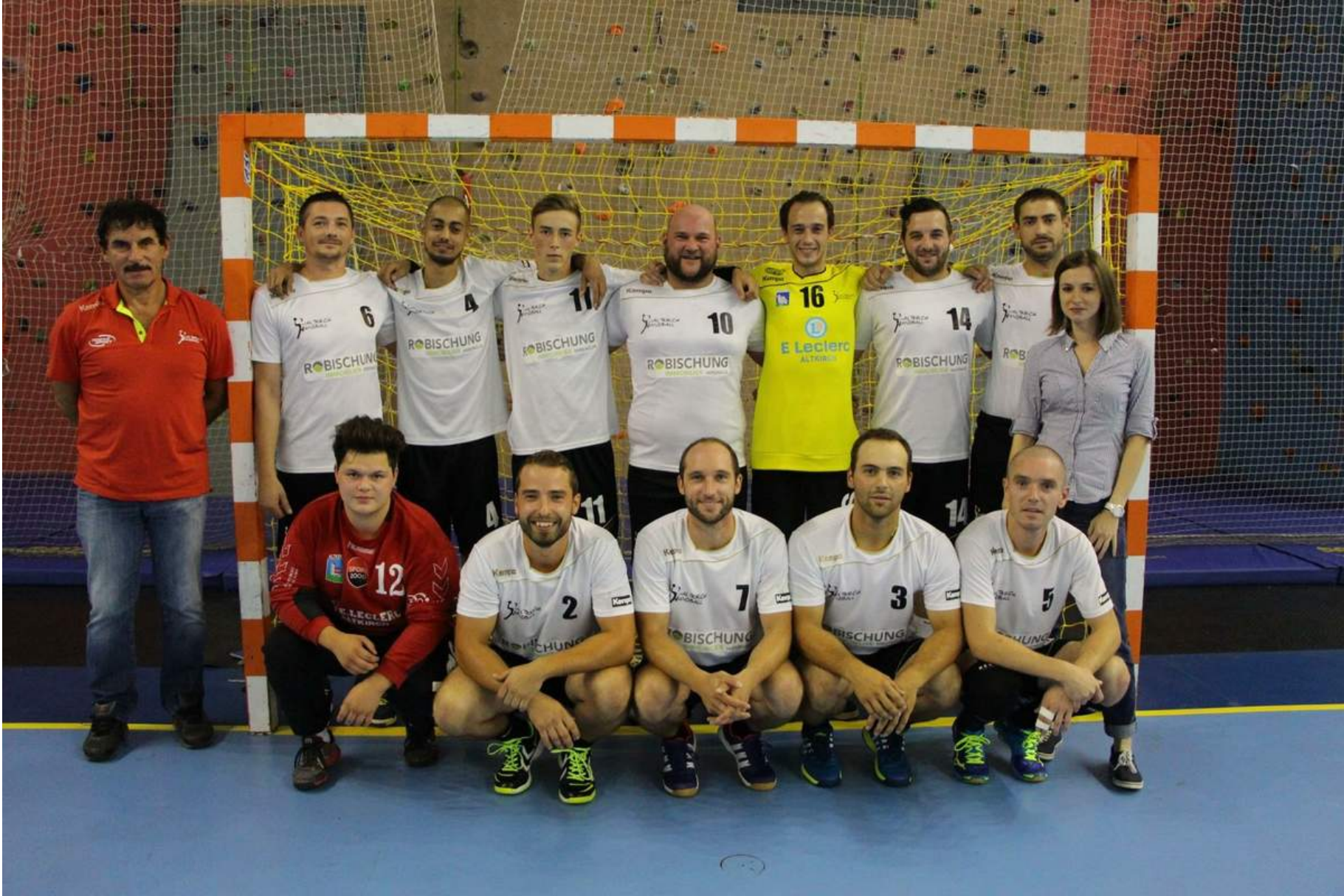
Classement de l'équipe 1 Masculine