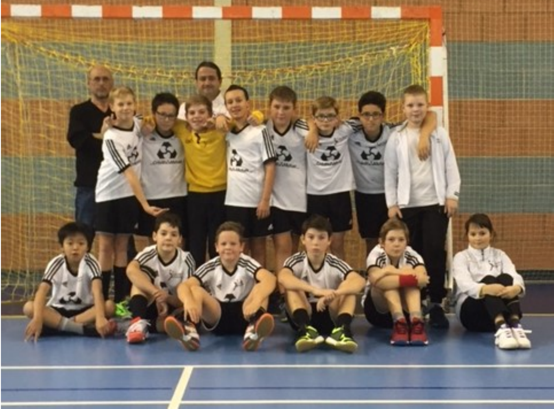
Classement des moins de 13 Masculins