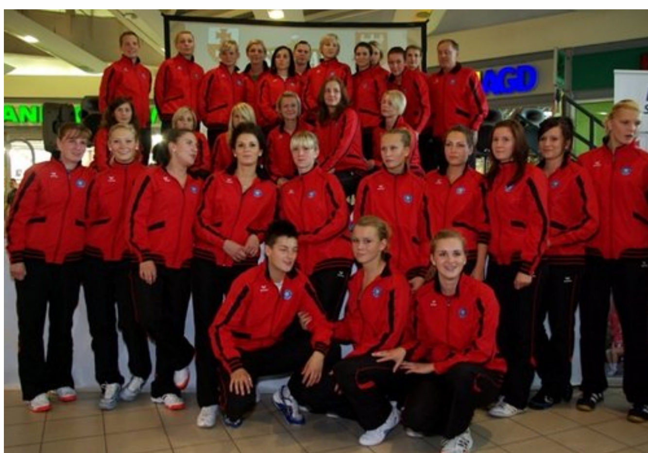
Zawodniczki EKS Start Elbląg podczas przedsezonowej prezentacji

We wtorkowy wieczór w holu C.H. Ogrody przy ul. Płk. Dąbka odbyła się prezentacja drużyn EKS Start Elbląg. Zgromadzeni kibice mogli zobaczyć zawodniczki, które w sezonie 2010/2011 będą walczyły na parkietach PGNiG Superligi oraz I ligi kobiet. Zobacz fotoreportaż.