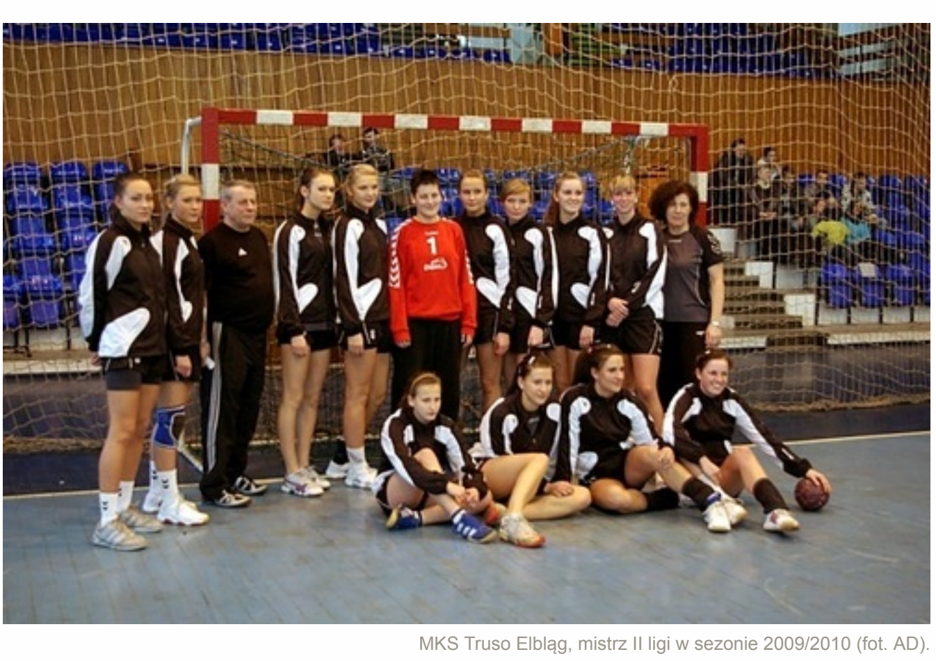
MKS Truso Elbląg, mistrz II ligi w sezonie 2009/2010.